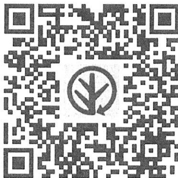
臺灣林產品生產追溯

一、追溯條碼上方標示「臺灣林產品生產追溯」文字，條碼下方標示申請者追溯號碼，此號碼係由直轄市、縣（市）代碼（2碼）＋類別代碼（2碼）＋流水號（6碼）組成，共10碼（如下圖）；另可依個別使用需求，於生產追溯系統登載生產或出貨批號，以茲識別不同批次產品。